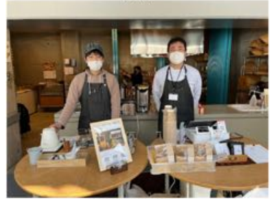
平岡クラフト工房