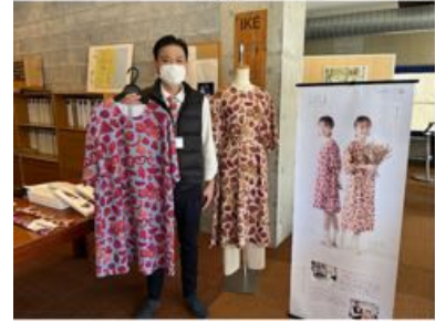
FEM TRE NOLL