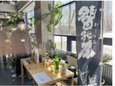
島越竹細工 産地を守る会