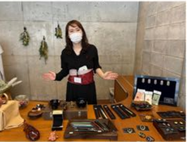
工房ハジカミ/ゆうび